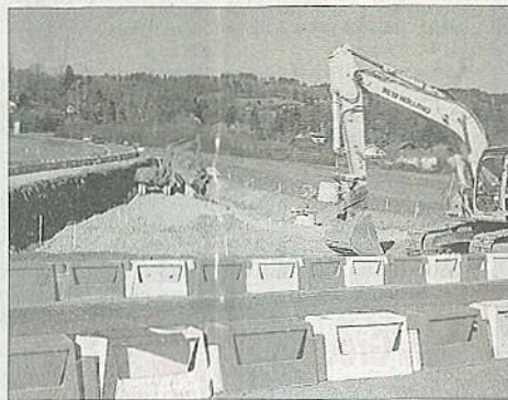
La route de La Chapelle sera fermée à partir du lundi 21 mars. Le D.L.R.M.C.