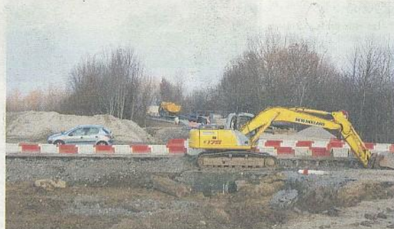
Les travaux devront rattraper la forte déclivité qui existe sur ce tronçon de route et rend le chantier plus difficile qu'un rond-point classique.

Le rond-point d'Éteaux va enfin sortir de terre. Six mois de désagréments pour sécuriser le croisement RD155/RD1203.