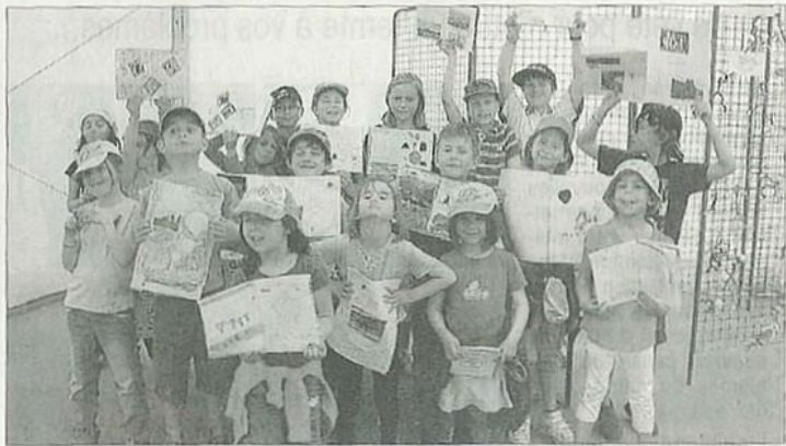
Les élèves de l'école des Crues ont présenté leurs carnets de voyage. Le DLRMC.

Les responsables du stand avaient aussi aménagé un petit coin doté de coussins pour proposer aux enfants qui le désiraient des lectures, dont les textes étaient tous tirés des œuvres exposées sur le salon, mais adaptées à l'âge des différents auditeurs.